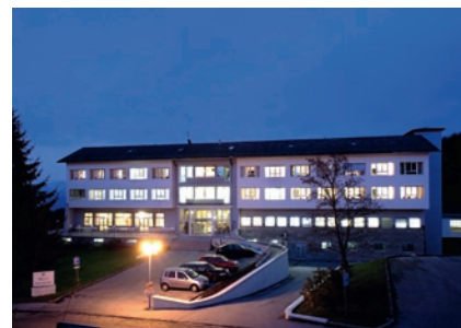
EMCO Privat-Klinik Bad Dürrenberg