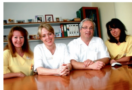
Babywunsch-Klinik Dr. Zajc