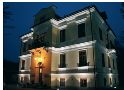
Privatordeination im Kompetenzzentrum Salzburg